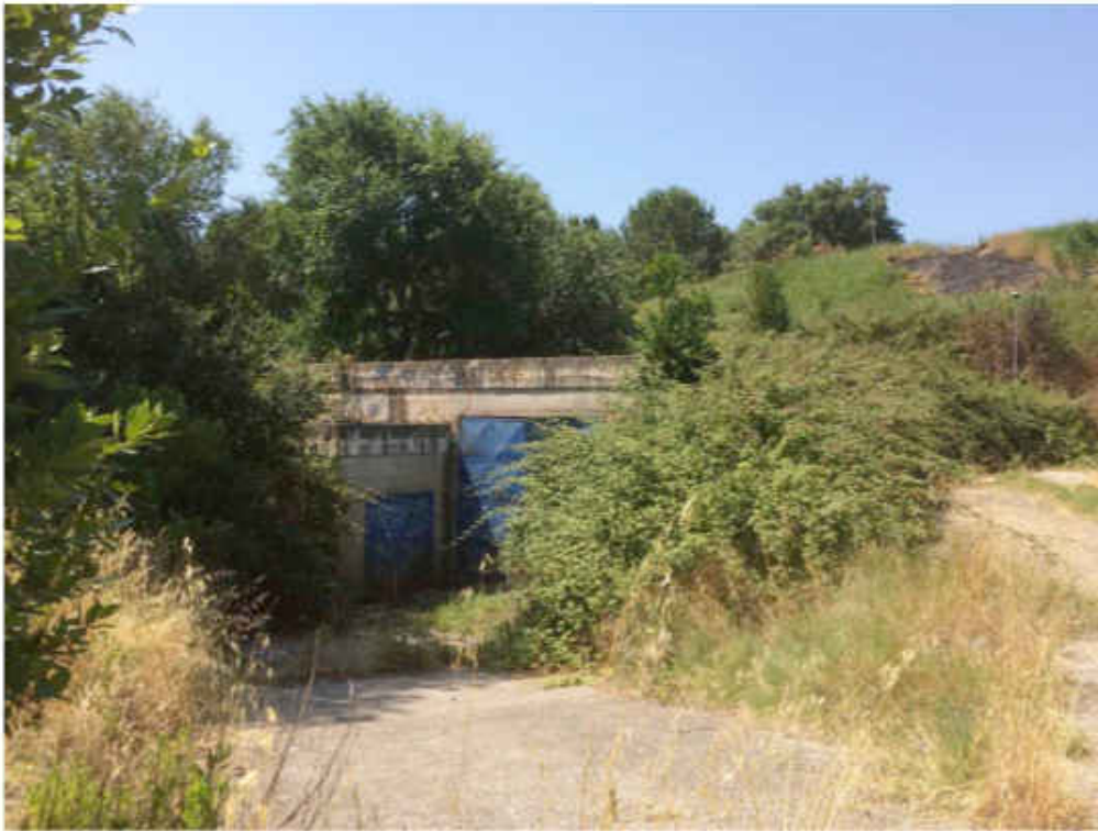
Impianto di depurazione dismesso.