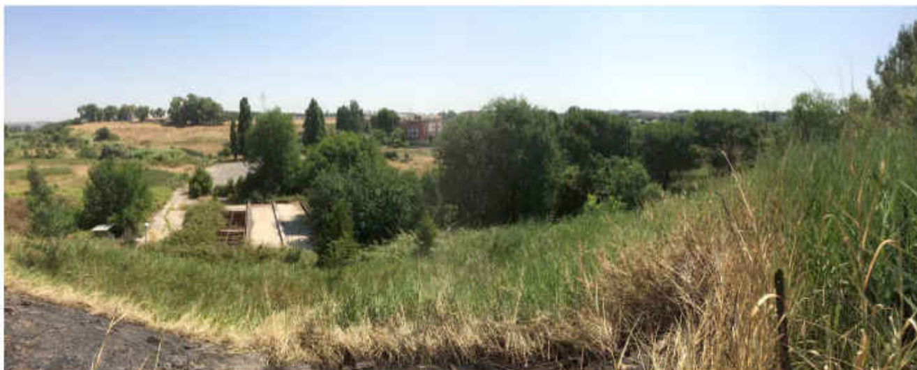
Panoramica dell'area dell'impianto dalla rotonda finale di Via Vincenzo Petra.