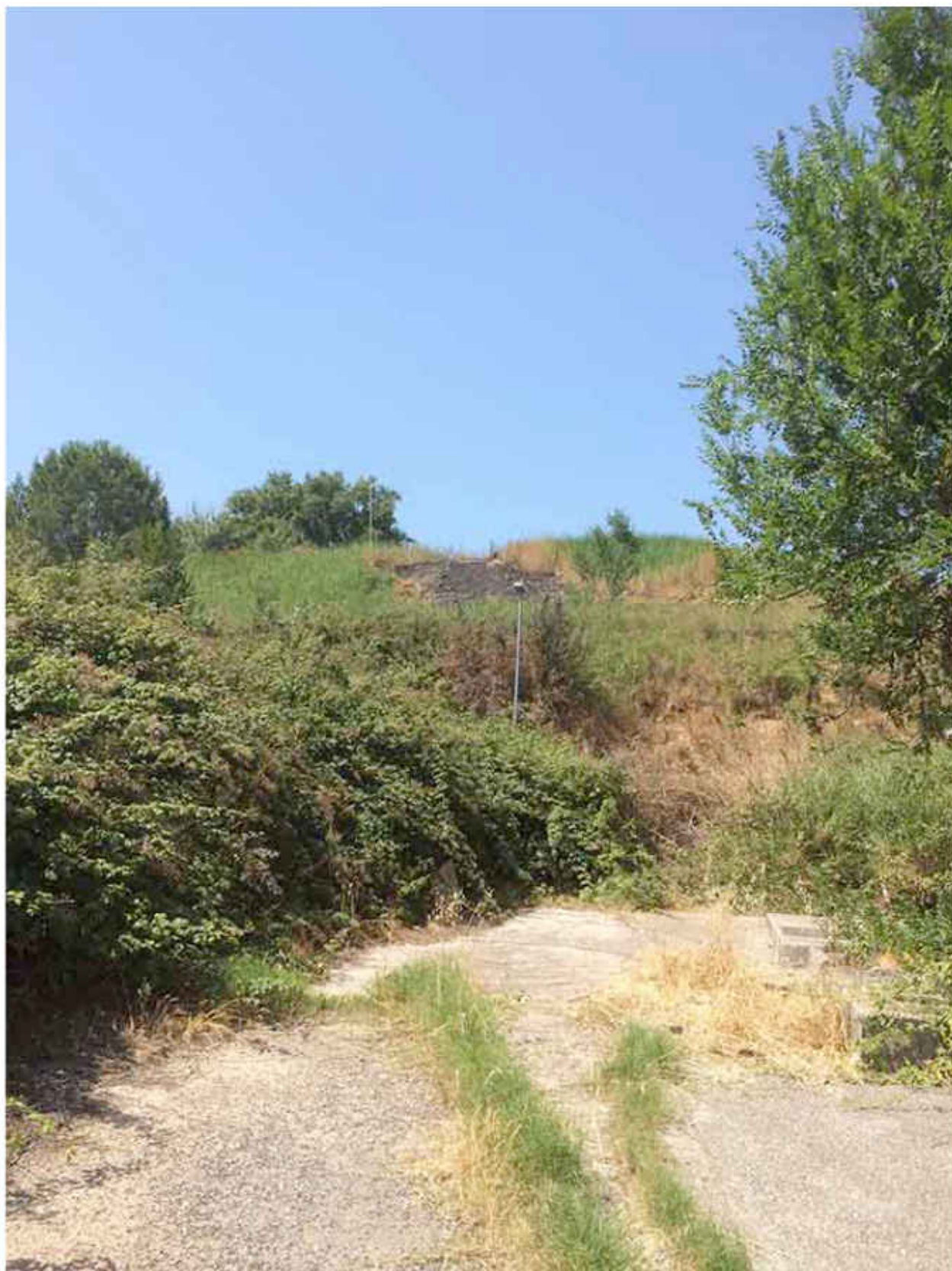
Segni dell'incendio del 01/07/2019, il fuoco a lambito il quadro elettrico .