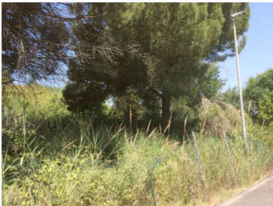
Vegetazione all'interno dell'area dell'impianto.