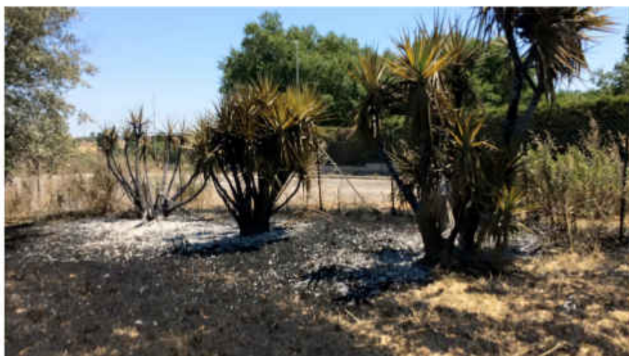
Area di inizio incendio.