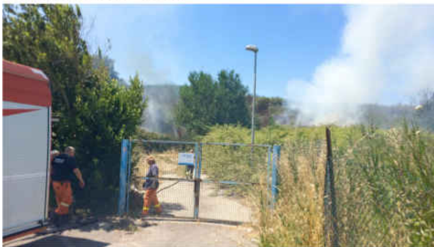
Intervento dei vigili del fuoco nell'area dell'ex depuratore.