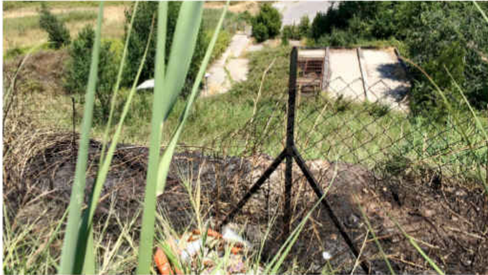
Area interessata dal fuoco.