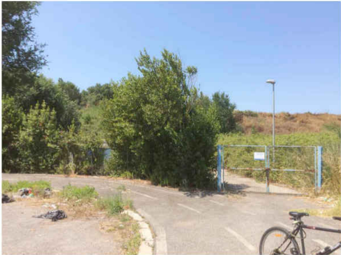
Accesso all'impianto dalla rotonda finale di viale A. Ottaviani.