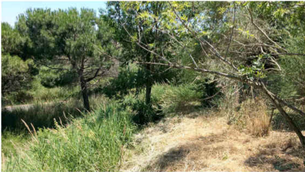
Area confinante il condominio. E' stato realizzato uno sfalciato parziale antincendio, non è stato possibile proseguire perché il terreno è troppo scosceso.