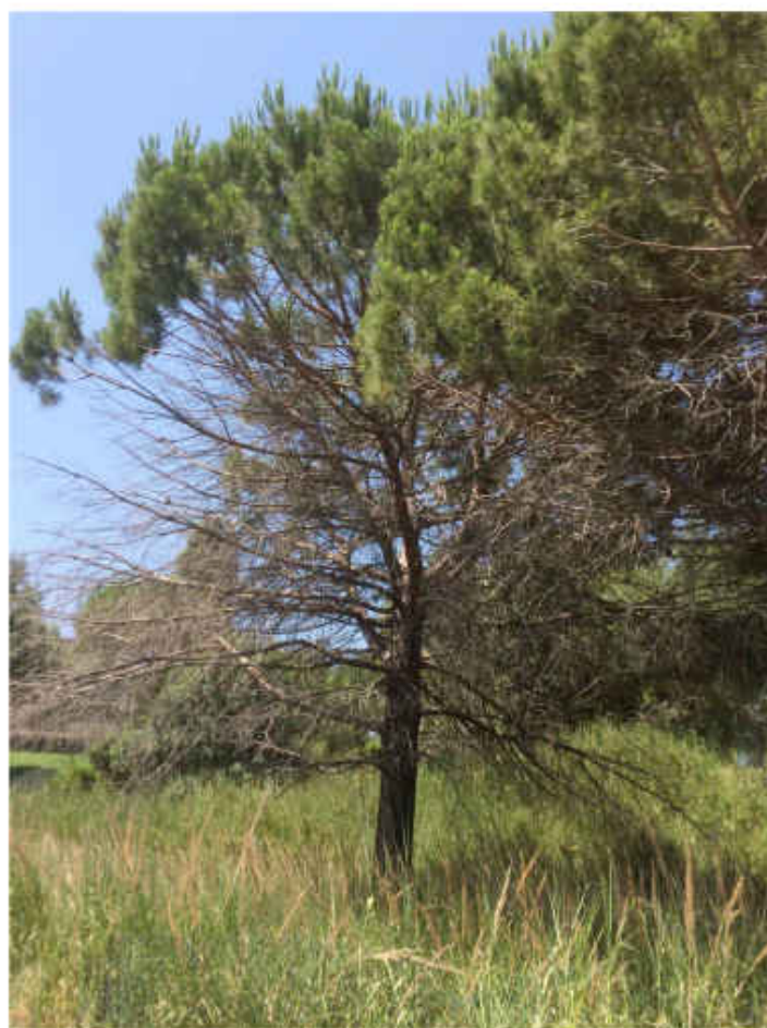
Alberi d'alto fusto danneggiati da precedenti incendi all'interno dell'area dell'impianto.