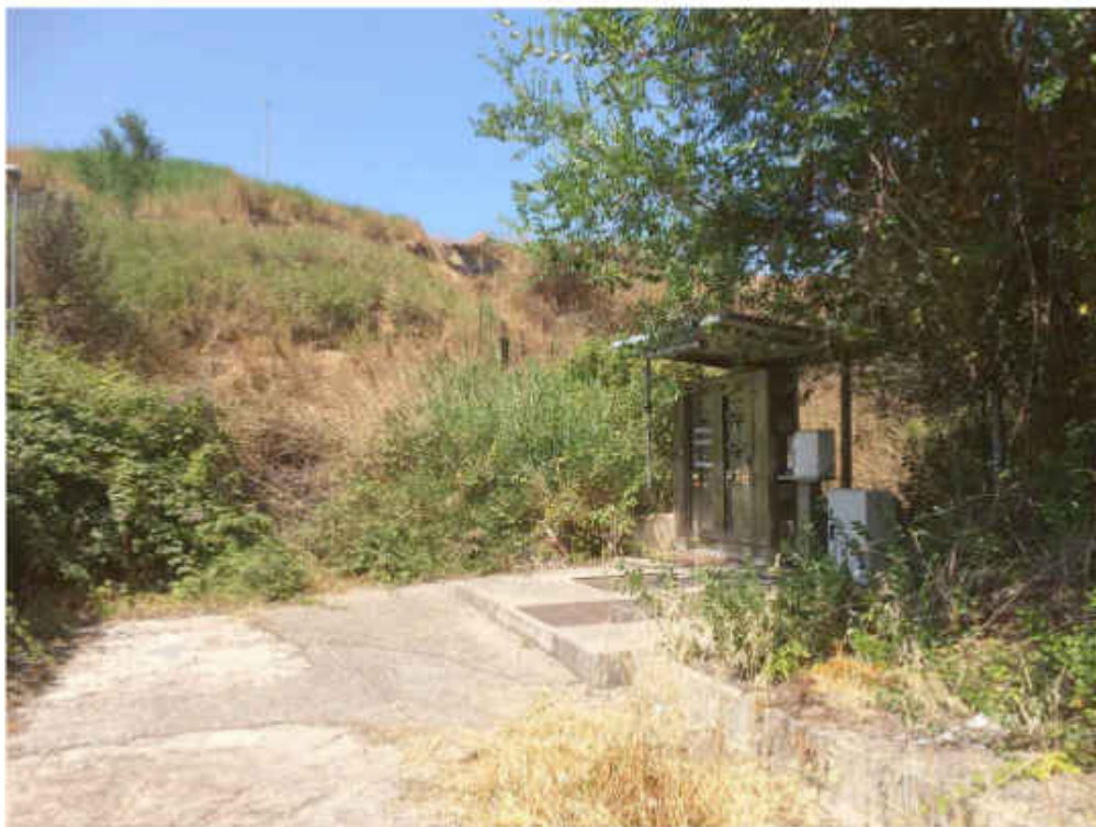
Quadro elettrico in funzione, presumibilmente dell'impianto di pompaggio acque reflue.