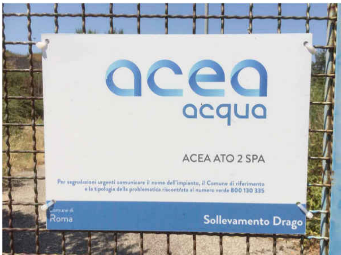
Tabella all'ingresso dell'impianto.