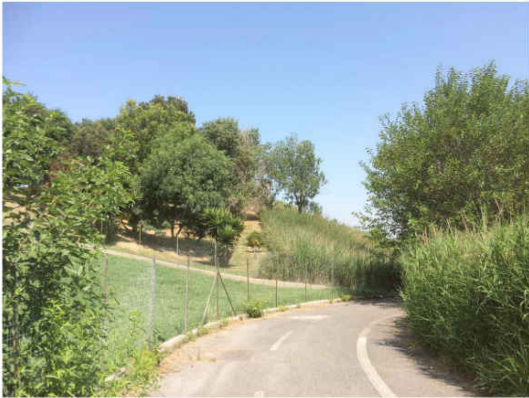
Giardino condominio via Petra 300 a sx in fondo, a dx il canneto presente nell'area dell'impianto.