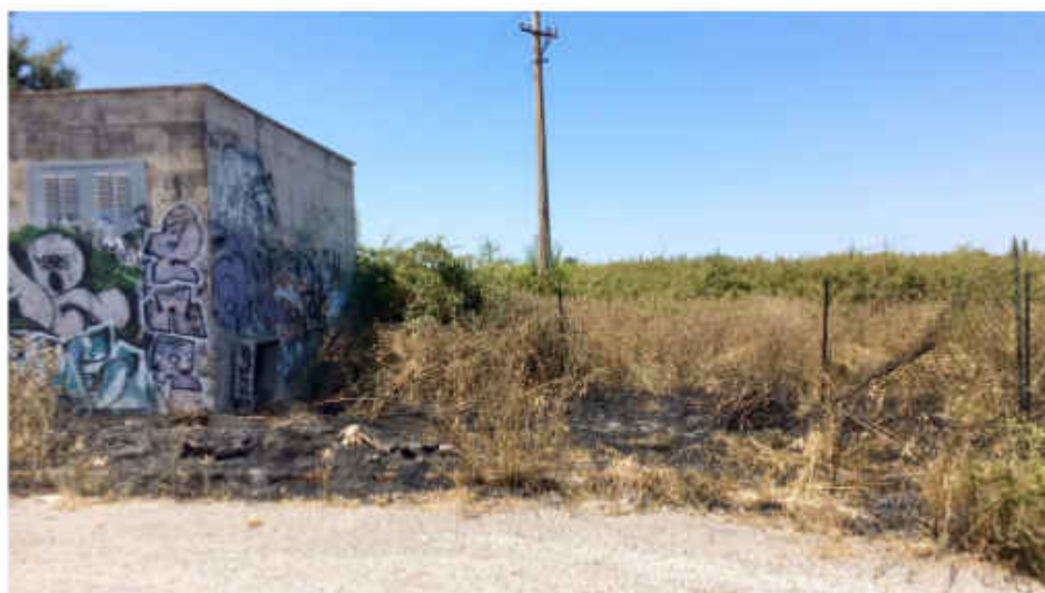
Cabina elettrica di Via Petra.